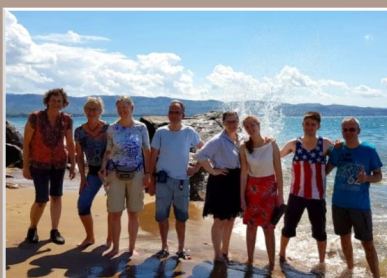
Haulerwijkers in Malawi